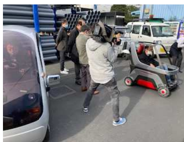
超小型モビリティ試乗会