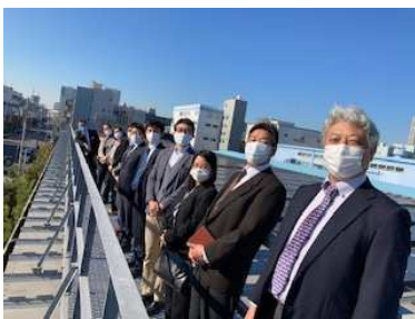
東京ガス様見学会