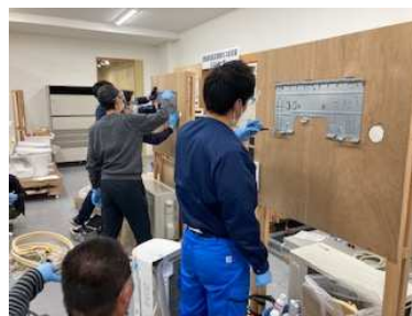
エアコン施工研修