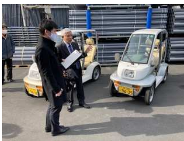
超小型モビリティ試乗会