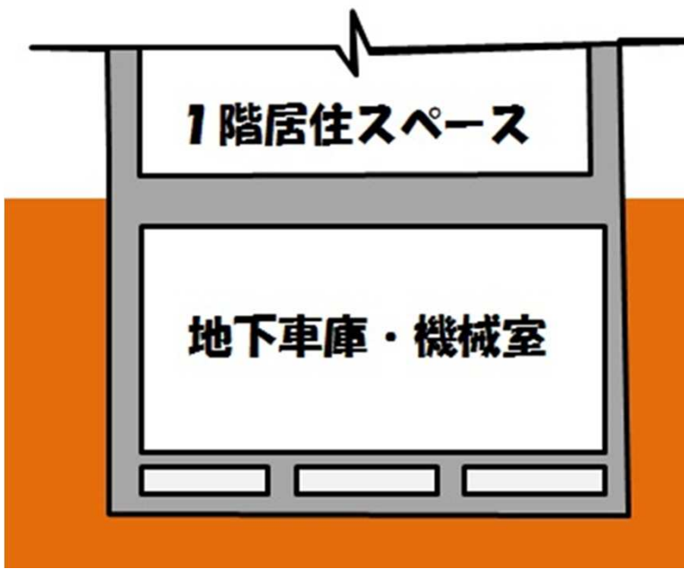
画1 マンション断面 地価は駐車場と機械室