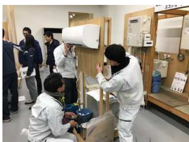
エアコン施工研修