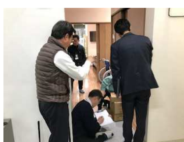
TOTOリモデル相談室様