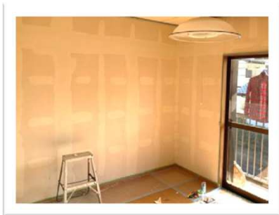
Before(前のを剥がした後)