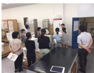
セントケア様AD研修