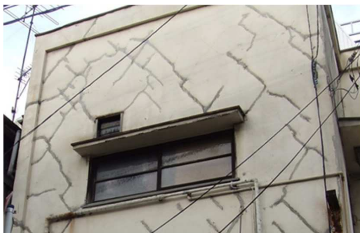
画2 外壁の剪断？亀裂

このような場合、逆にチャンスなのかも知れません。東雲便りを読んでおられ、リフォーム事業をされておられるほとんどの方々は、長年、地場を持って設備機器に関わってこられた方々だと思います。つまり、それぞれの土地にしっかりと立っていることが信用につながるのです。あとは、しっかりと知識を持ってお客様に説明をしていけば、必ず信用されるのです。