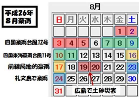
画1 8月と各地の豪雨災害発生日

また、8月は「平成26年8月豪雨」と気象庁が命名したようにほとんどに日々どこかで豪雨災害に見舞われていました。(画1)