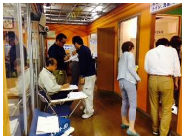
リフォーム産業新聞取材