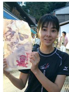
名物の丸焼きたこせんべい