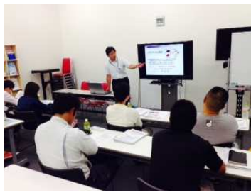
エコ事業コンソーシアム