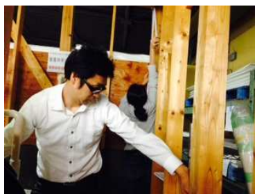
インストールUB研修